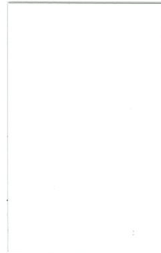
高透光ホワイト [透光率:10.0%]