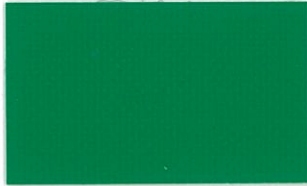
T-09 フォレストグリーン [透光率:0.2%]