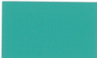
T-04 エメラルドグリーン [透光率:0.2%]