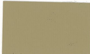
T-51 ライトブラウン [透光率:0.1%]