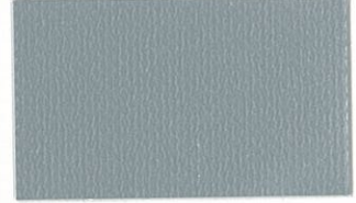
T-21 シルバー [透光率:0%]