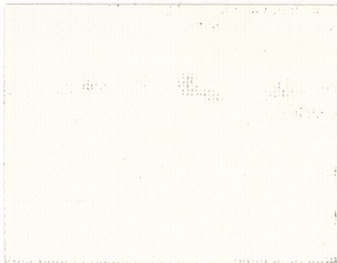
T-17 アイボリー [透光率:3.5%] ←2M→ *203cm巾品の在庫は、アイボリーのみとなります。