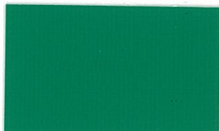
T-07 グリーン [透光率:0.1%]