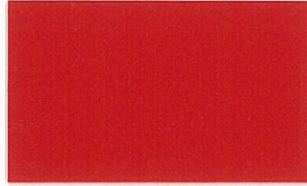
T-13 レッド [透光率:0.7%]