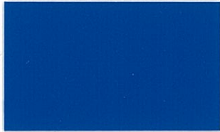
T-01 ロイヤルブルー [透光率:0%]