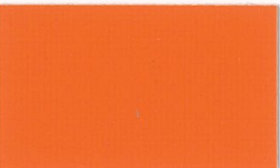
T-12 オレンジ [透光率:2.4%]